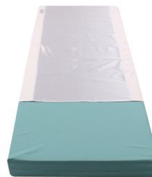
Silk Master - L