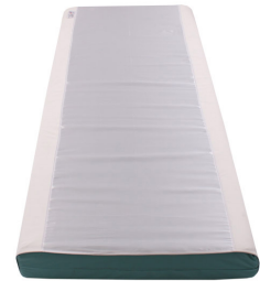
Silk Master -XL