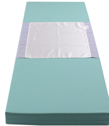
Silk Master Pro - S