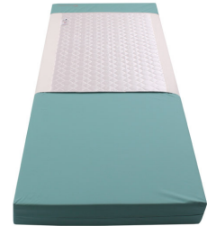
Silk Master Inco - M