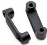
D-beslag Antal: 4