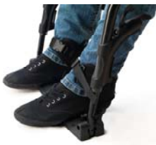
Ankelbespænding 1 par