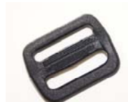
Glider Antal: 4