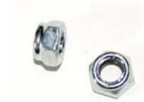
Møtrikker Antal: 8