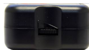
Ændring af lydssignal Maks. Min.

På Timestokkens kortsider finder du lydreguleringen for ændring af lydfrekvens. Når denne er stillet lavest, er lyden helt væk, og signalet bliver kun givet som blinkende prikker.