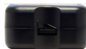
Ændring af lydssignal Maks. Min.

På Timestokkens kortsider finder du lydreguleringen for ændring af lydfrekvens. Når denne er stillet lavest, er lyden helt væk, og signalet bliver kun givet som blinkende prikker.