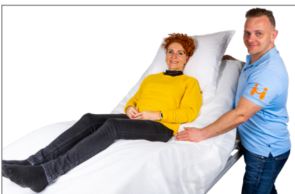
15. Sikker at bruger er placeret korrekt på One Time Lift samt i sengen ift. hofteknækket. Aktiver knæ-knæk og derefter hæves hovedgæret.