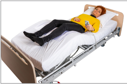
10. Bruger aktiverer sengens knæ-knæk.