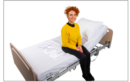
12. Bruger kan nu rotere på siddefluden samt glide ben ud over sengekant ved hjælp coverets glidefelt.