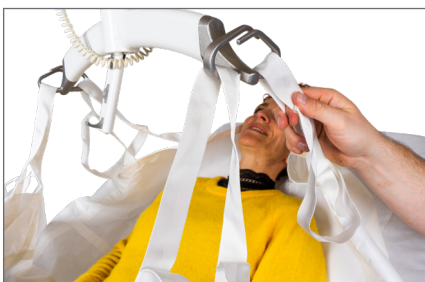
16. Sæt topstropper og benstropper på liftåget – brug de inderste øverst og de yderste nederst.