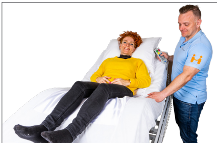
14. Hjælper eleverer hovedgærdet. Bruger kan benytte satinets glideevne til at tilpasse bækkenets placering. For ændring af ryggens placering flyttes i tværgående retning.