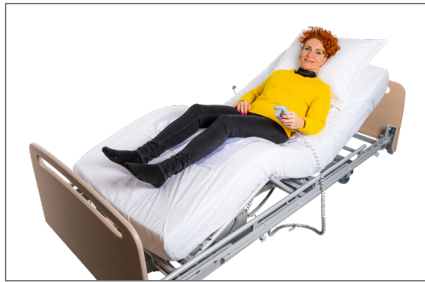
11. Bruger eleverer sengens hovedgærde.