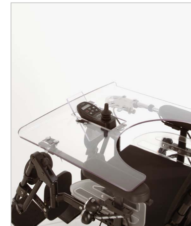
Styreenhed til midterbakke