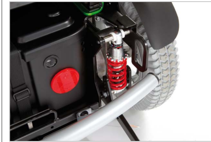
Affjedrede drivhjul (tilvalg)