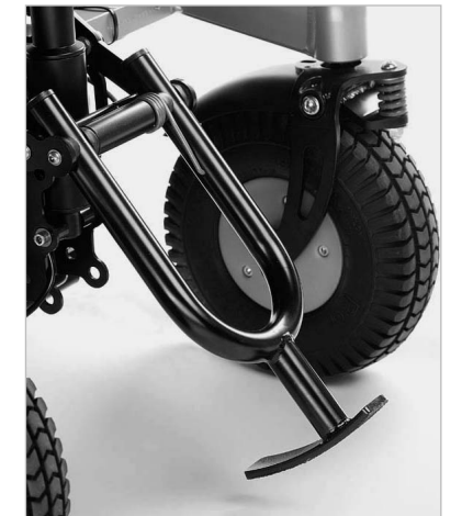
Kantstøtshjælp (gælder ikke B500S)