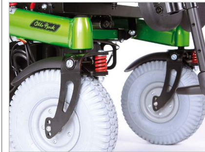
Affjedrede forhjul (tilvalg)