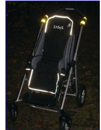
Polstring med refleks

JAZZ EASyS kan naturligvis foldes sammen, så den kan være i bilen.