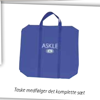
Taske medfølger det komplette sæt