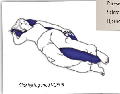
Sidelejring med VCP08

Pareser. Neurologiske patienter. Sclerose. Smertepatienter. Hjerneskadede. Terminale patienter.