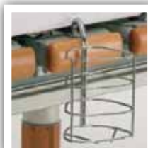
Holder til kolbe