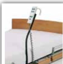
Lodret holder til håndbetjening