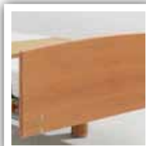
Sengegavl type MA