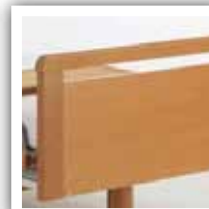
Sengegavl type FS