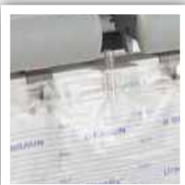
Kroge til kateterpose