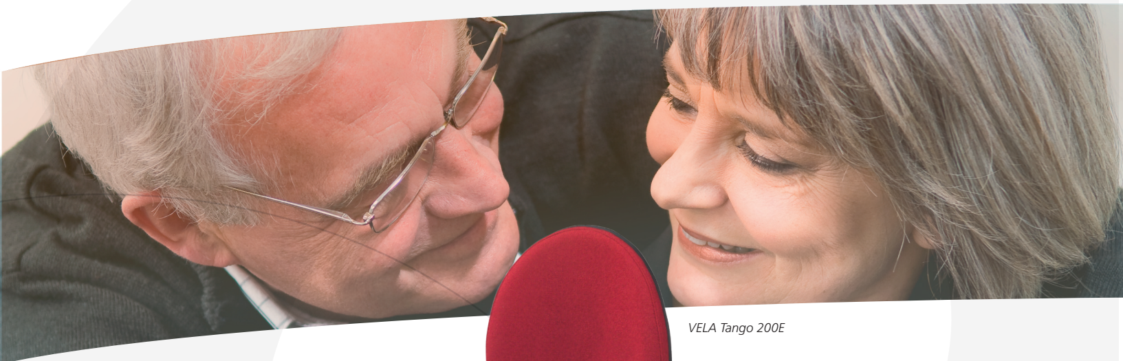
VELA Tango 200E