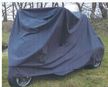
Vind- og vandtæt garage til Atlantis i 2 modeller.