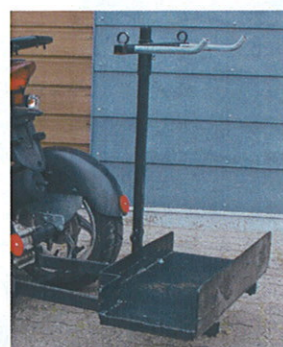
Stokkeholder m/rolator- og kørestols-holder. (TILBEHØR)

TGB leveres med en 120 liter stor boks, som også fungerer som ryglæn. Der er mulighed for at påmontere armlæn.