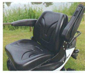
Komfortsæde med armlæn, justerbar ryghældning og af-fjedring. Sædehøjde fra 75 cm