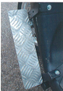
Benstøtteholder for stift ben -