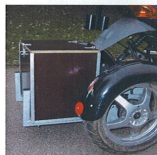
Kasse med bøjle - galvaniseret