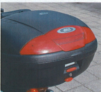
Stor aflåselig boks med god opbevaringsplads fås som tilbehør i 2 str.