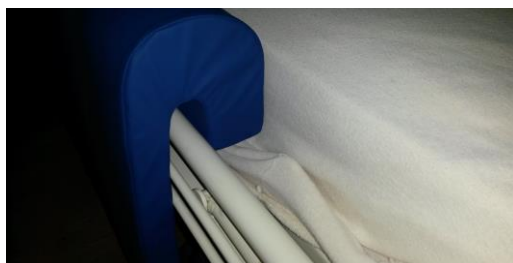
Sengehest beskytter med ”kort bøjle”.