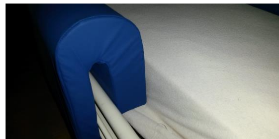
Sengehest beskytter med ”lang bøjle”.

Bemærk! Der kan købes aftagelige betræk med hotel-lukning/lynslås til alle vore beskyttelsesovertræk. Få tilsend en video, der viser monteringen af PU- skiftebetrækket.