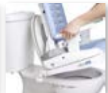
SÆDE PÅ STANDARD TOILET