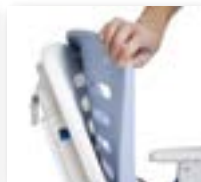
HYGIEJNISKE PUDER - LET AT SKIFTE