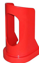
Lille Varenr. 80202

Produceret af brudsikker ABS plast. Rengøring med vand og sæbe.