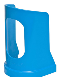
Stor Varenr. 80202