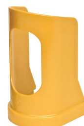
Medium Varenr. 80201