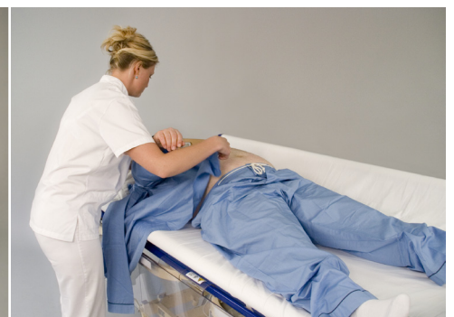
Påklædning og pleje