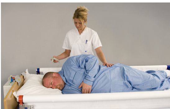
Vending og flytning

Ved tryk på håndbetjeningen, strammes lagnet omkring rullen, og patienten flyttes i sengen eller vendes om på siden.