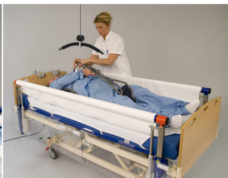
Pålægning af løftesejl