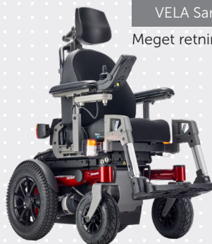
VELA Sango Slimline Jr. RWD

Drejer om sin egen akse, hvilket gør den nem at manøvrere på begrænset plads.