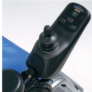
Enkel, funktionel kontrolboks