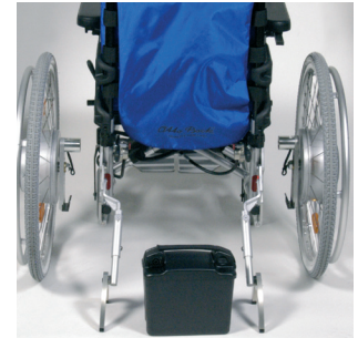
Hjulenheder og batteri - enkelt