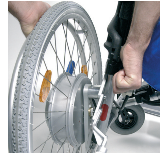
Enkel, hurtig hjulmontering