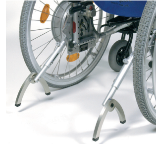
Tipsikringer med svingstøtter (tilvalg)