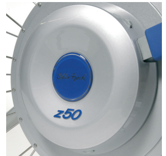
Nav med afkobling