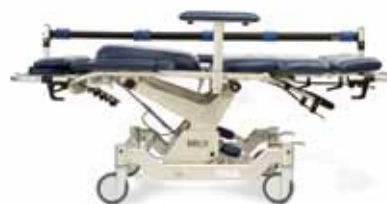
Barton med transerbarre