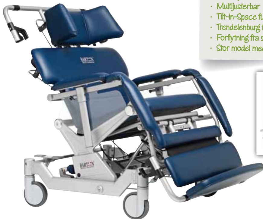
Justerbar nakkestøtte, fodhviler og armlæn