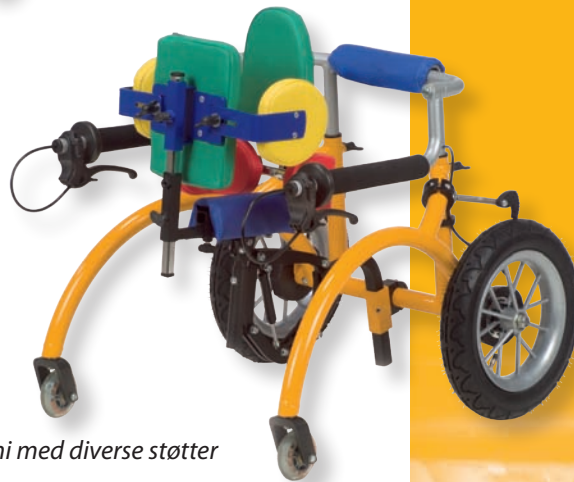
Kimi med diverse støtter

Basis designet af "Kimi støttesystemet" er baseret på en bagudvendt gåvogn med en thorakal støtte enhed, som en tilbehørsmulighed. Denne enhed kan fjernes og dermed kan "Kimi" bruges til forskellige typer og former for handicaps.