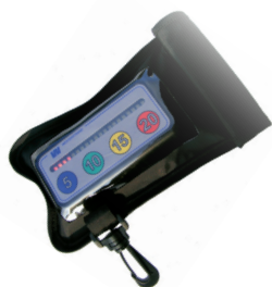
Med Beskyttelsestaske tåler Timestokken hårdere behandling (Tilbehør)