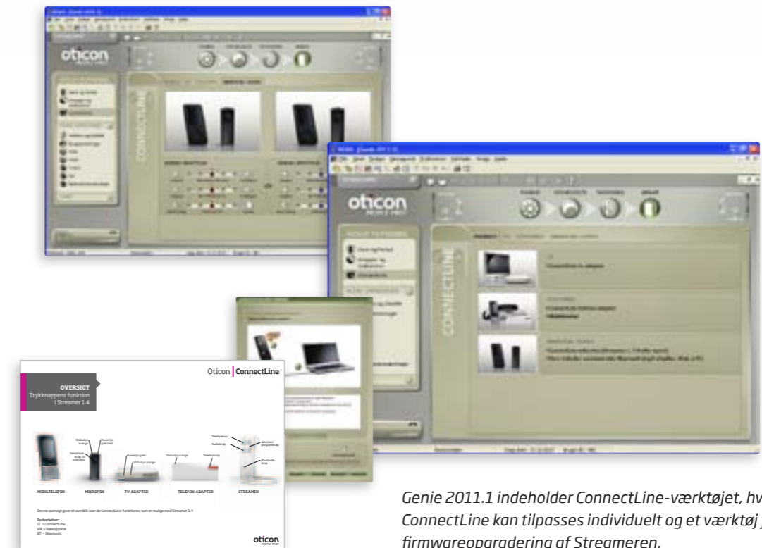
Genie 2011.1 indeholder ConnectLine-værktøjet, hvor ConnectLine kan tilpasses individuelt og et værktøj for firmwareopgradering af Streameren.

tilpasses og opgraderes nemt i Genie 2011.1