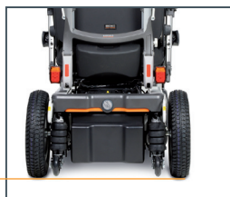
Full Track Suspension System