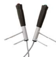
Håndtak med el kontroll