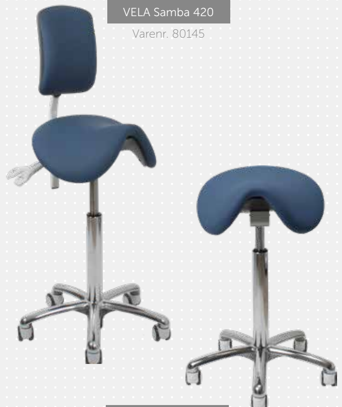
VELA Samba 400