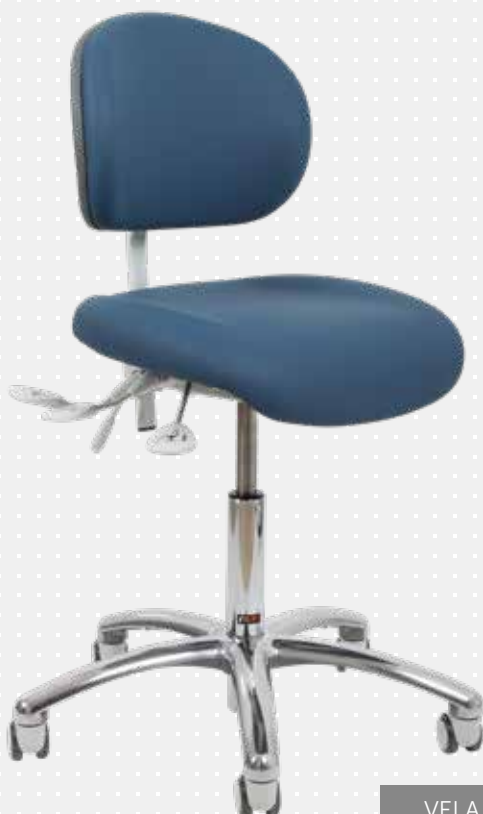
VELA Latin 100