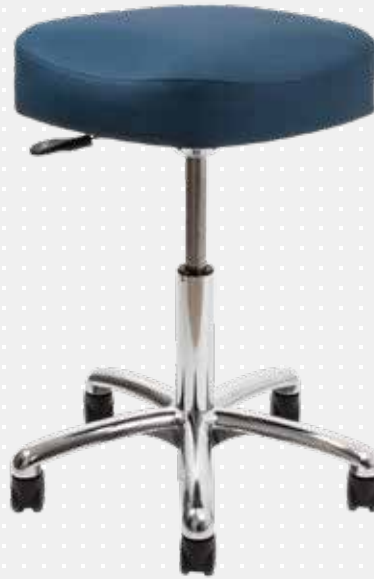
VELA Samba 410

Det unikke sæde aktiverer kroppens balance på samme måde som en pilatesbold