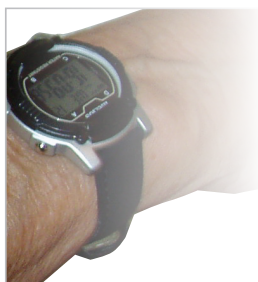
Vælg alarm som lyd, vibration eller begge deler

MEMOmini Timestokken 60 minutter med lydregulering Timestokken 20 Minutter med lydregulering Huskeur med lyd Cadex klokke MeDos II