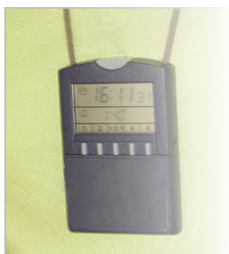
Huskeur har snor med sikkerhedslås