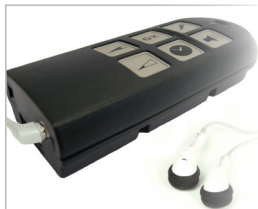
MEMOmini leveres med ørepropper, snor og bæltetaske