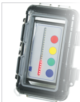
Med Beskyttelsestaske tåler Timestokken hårdere behandling (Tilbehør)