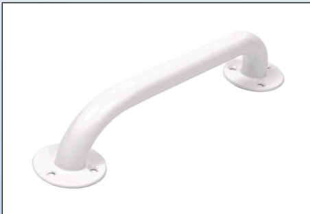
N3. Stålgreb med Rilsan® belægning

Stålgreb kan leveres i længderne 16 cm, 25 cm, 30 cm, 40 cm, 50 cm, 60 cm, 75 cm og 90 cm