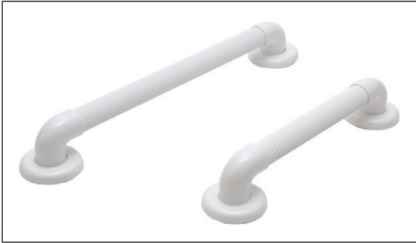
N1. Støttegreb i hvid PVC