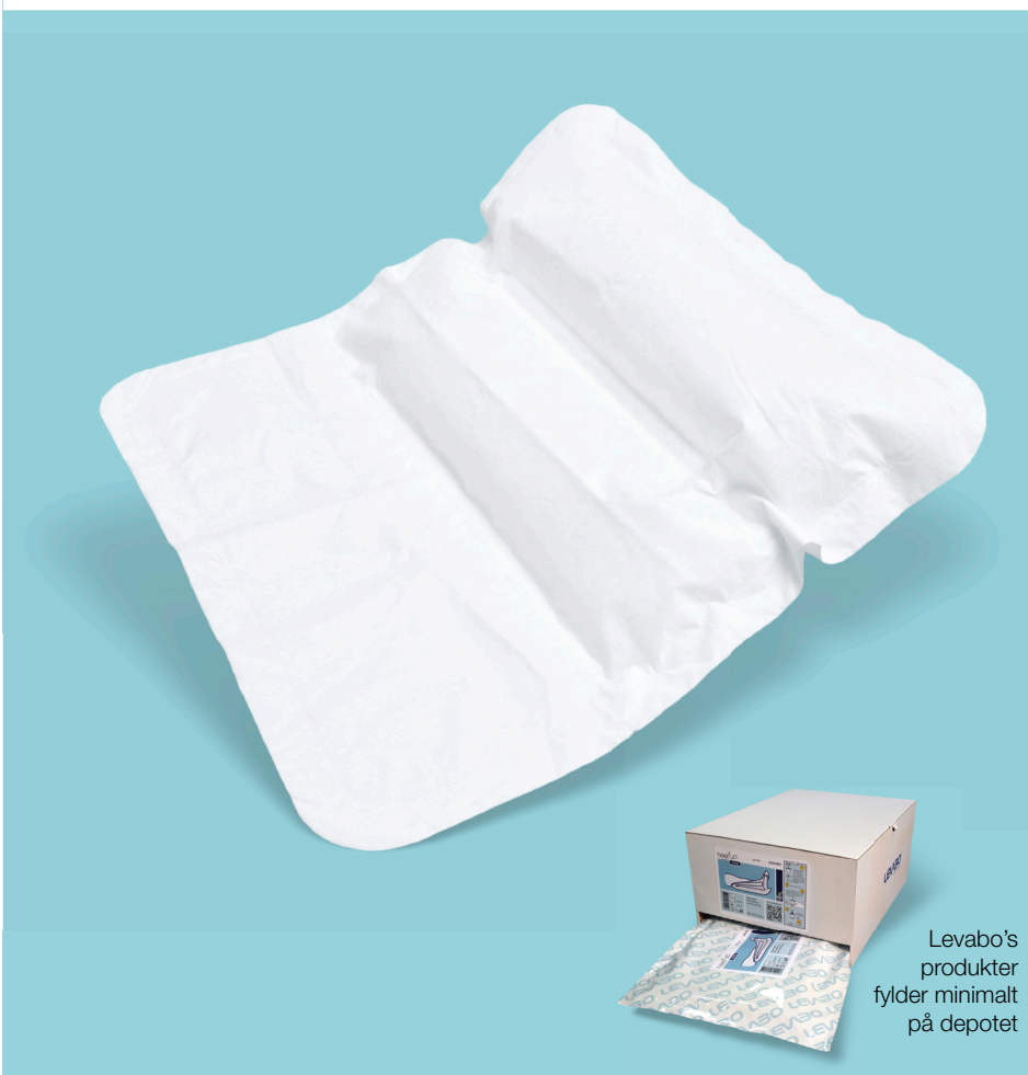
Levabo's produkter fylder minimalt på depotet