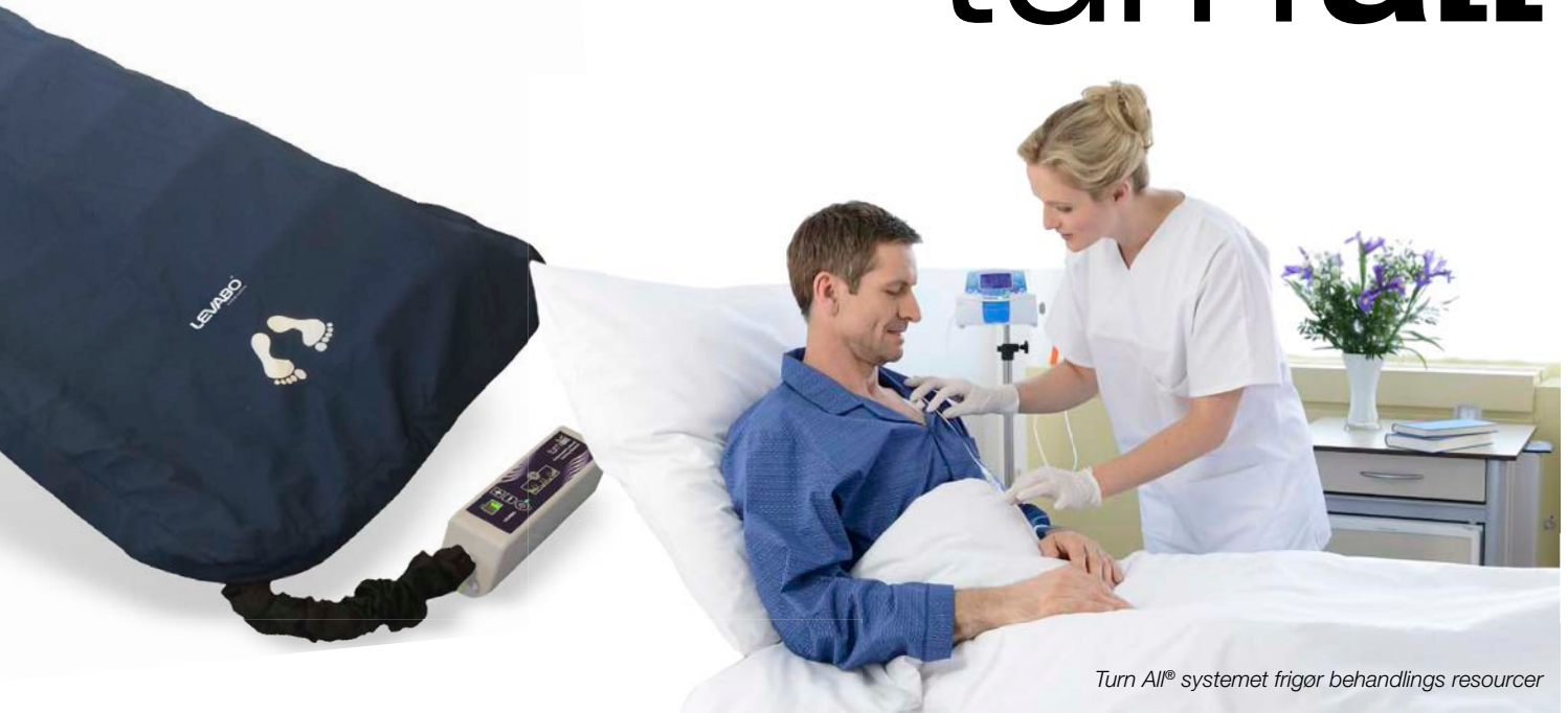
Turn All® systemet frigør behandlings ressourcer