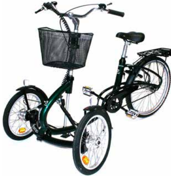
Illustrationerne kan vise udstyr, der fås som ekstra tilbehør.