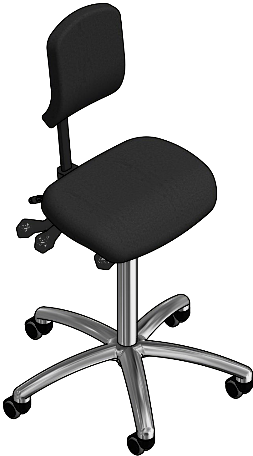
VELA Samba 150