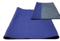
Unique Slide Royal