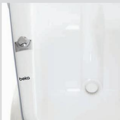
En særlig proces sikrer ovenstående Gennemsnitlig hurtig tømning af badekarret