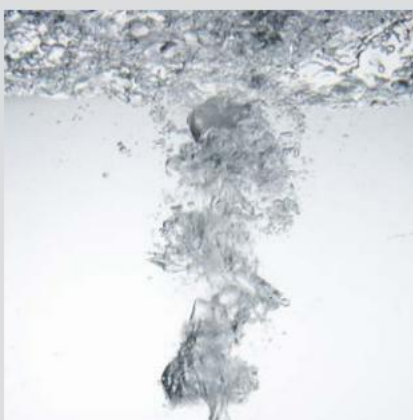
Valgfrit: Luftboblebad med cirkulationsfremmende effekt forstærkende massageeffekt