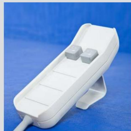
Fjernbetjening for nem hældningsjustering