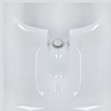
Sædeflade med ekstra stor hygiejneåbning