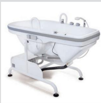
Kompakt design sikrer lav vægt Pladskrav til badekarret