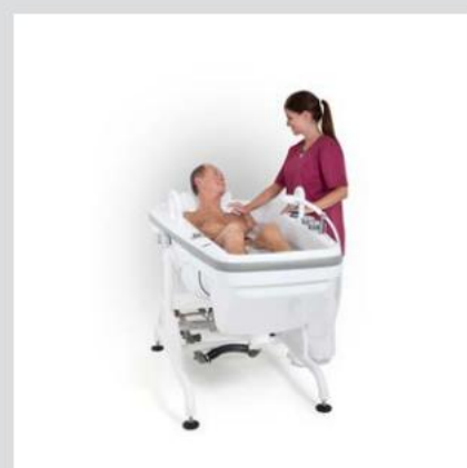
Den trinfri, elektriske vippefunktion bringer beboeren i badestilling