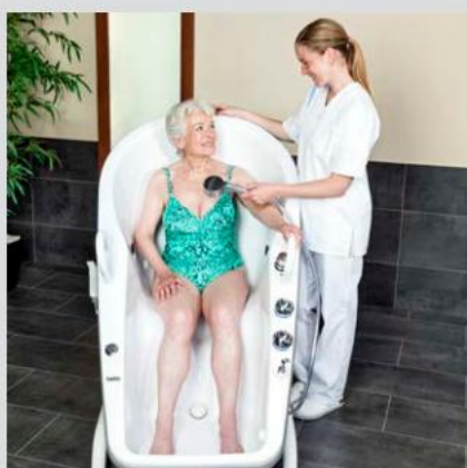
Absolut sikker sidde- og liggende stilling uden risiko for at glide