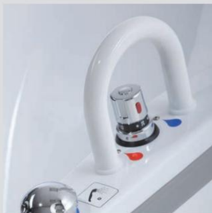
Store håndlister for sikkerhed Af- og påstigning