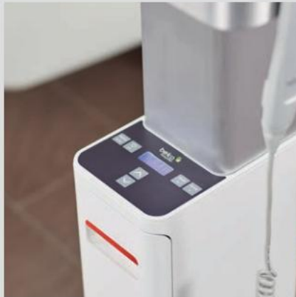
Valgfrit: Integreret patientvægt