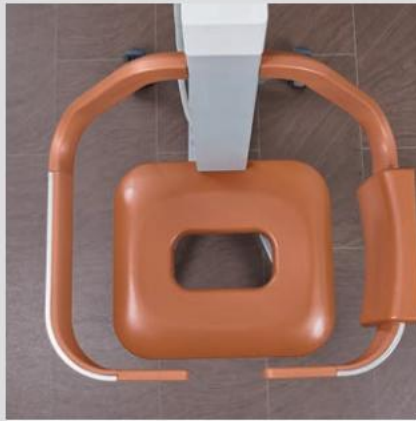
Ergonomiske sikkerhedsreb på styret muliggør præcis manøvrering.