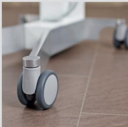
Letrullende dobbelthjul, to af dem kan bremses og låses