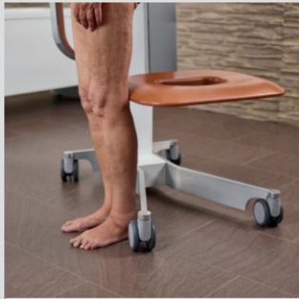
En lav indstigningshøjde på 49,5 cm muliggør nem selvindstigning.