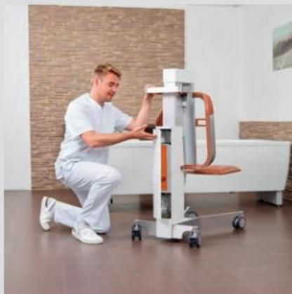
Batteri og nødstopfunktion