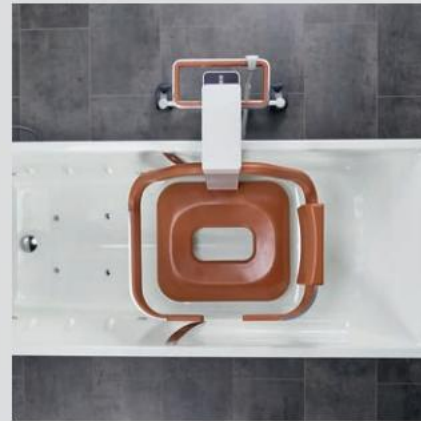
Komfortsæde med forsigtig åbning