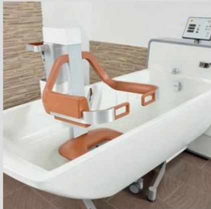
Passer nemt ind i enhver moderne plejebadekar