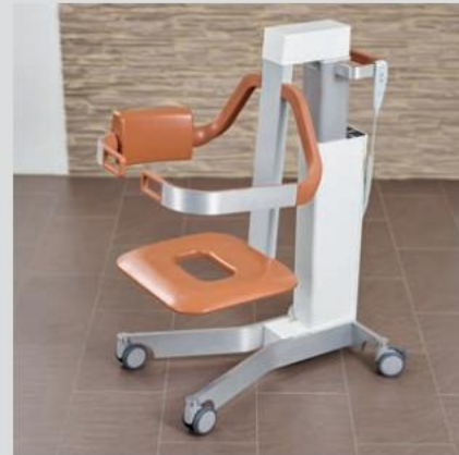
Højkvalitets aluminium og rustfrit stål konstruktion